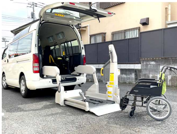
※リフト付きの車で送迎いたします。