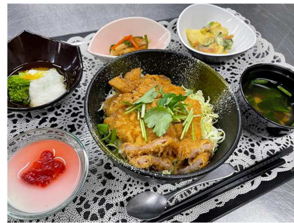
※配食を利用することで臨機応変な対応可。