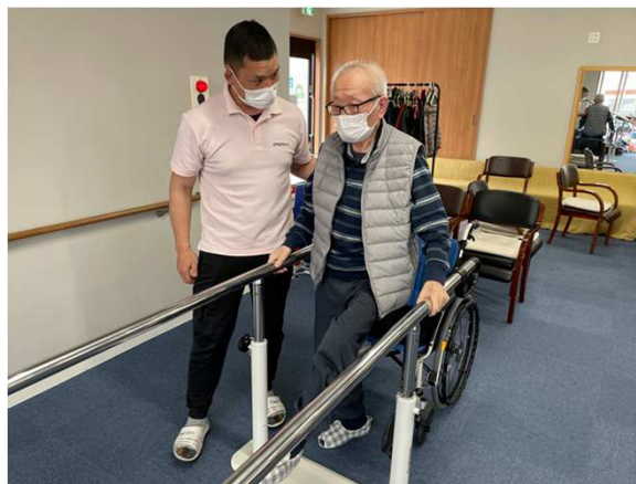
※平行棒を使った歩行訓練の様子。