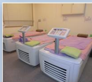
ウォーターベッド